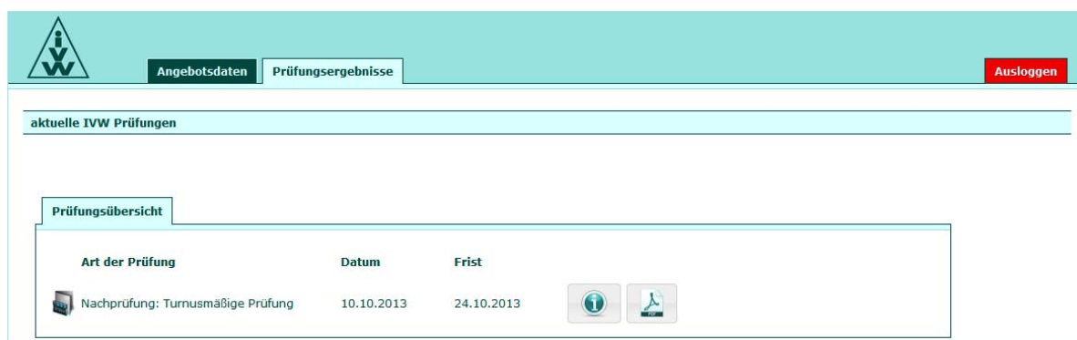
Screen 2: Prüfungsergebnisse

Hier finden Sie bereits abgeschlossene und aktuelle Prüfungen zu Ihrem Online-Angebot mit dem Datum der Prüfung, der Frist zur Mangelbeseitigung und der Darstellung des Prüfberichts. Den Prüfbericht können Sie wie gewohnt für Ihre Unterlagen als PDF downloaden. Über den Button „i“ gelangen Sie zur interaktiven Prüfcheckliste.